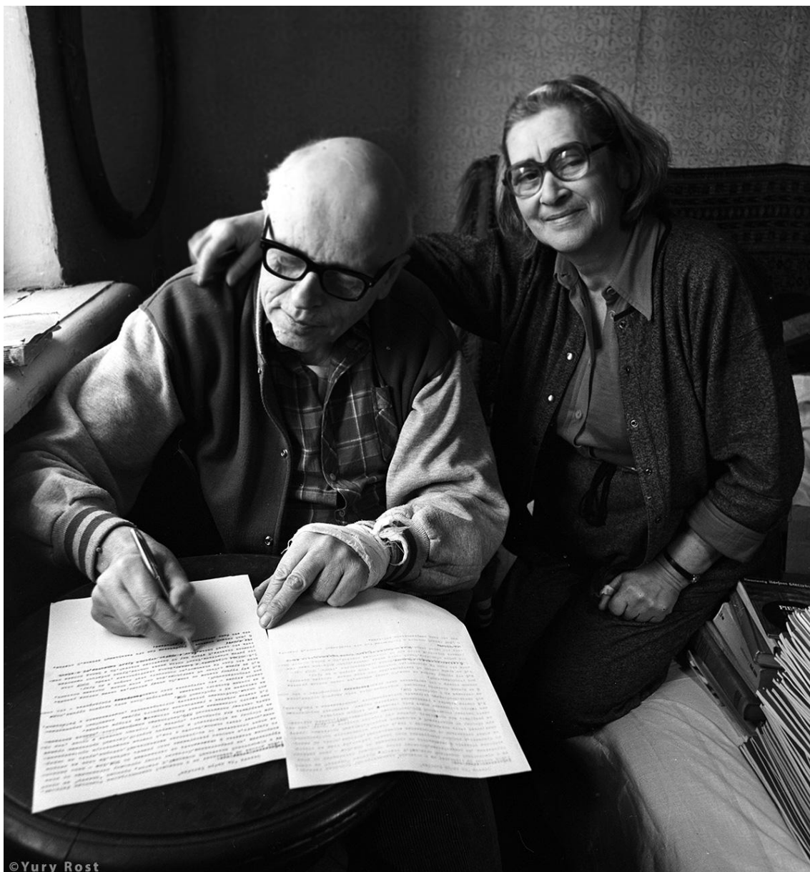
Andrei Sakharov com a sua mulher Jelena Bonner