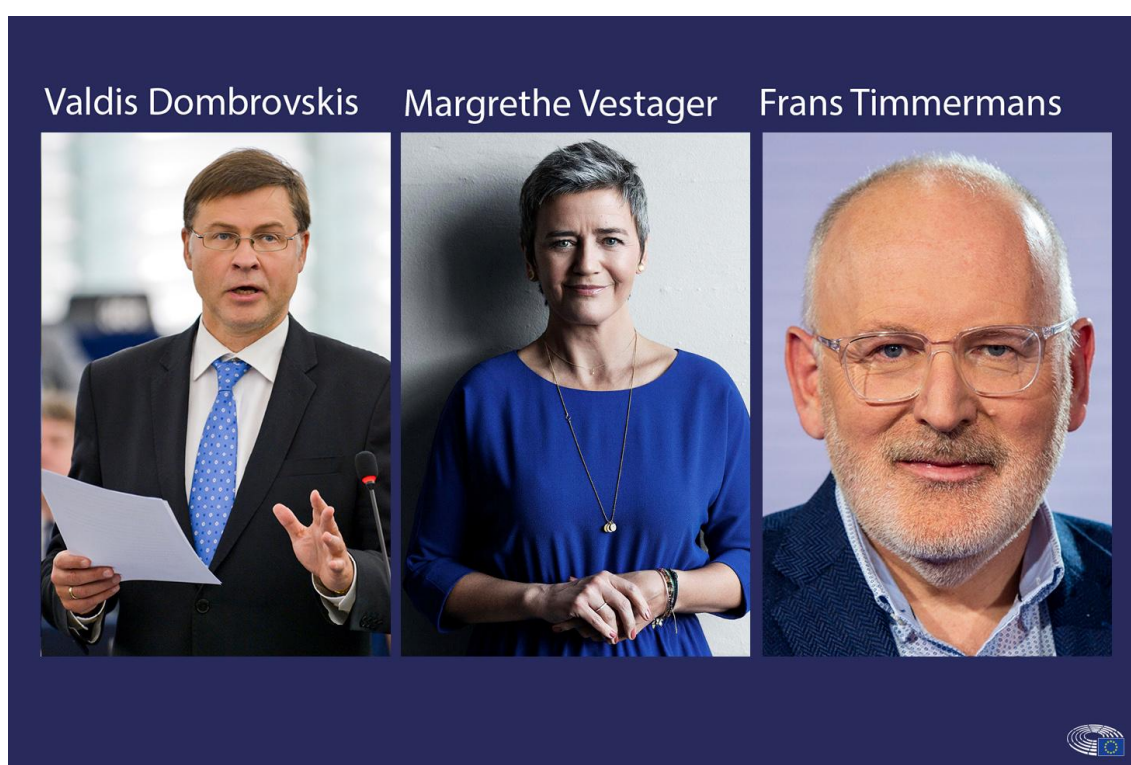
Audições de terça-feira: Dombrovskis, Vestager e Timmermans

Na terça-feira, 8 de outubro, as comissões parlamentares vão conduzir audições aos três Vice-presidentes Executivos indigitados: Dombrovskis, Vestager e Timmermans.