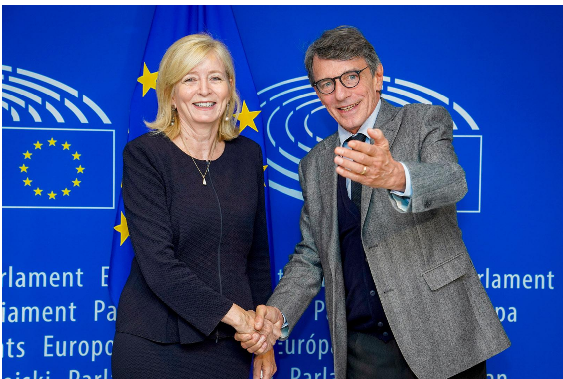
Emily O'Reilly (z lewej) i Przewodniczący PE David Sassoli

Emily O'Reilly została ponownie wybrana przez Parlament Europejski na Europejską Rzecznik Praw Obywatelskich i będzie nadal rozpatrywać skargi wniesione przeciwko organom UE.