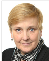
Róza Gräfin von Thun und Hohenstein

A gépjárműveknek az általános biztonság tekintetében történő típusjövahagyása