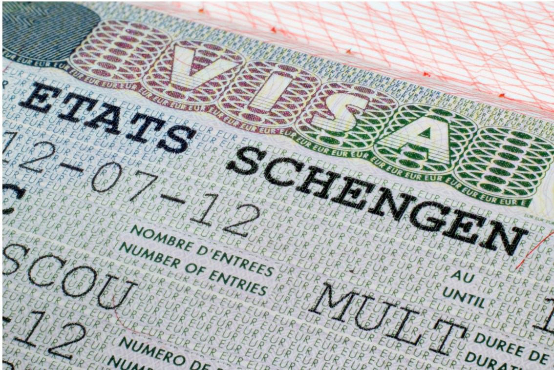
The Schengen zone is one of the pillars of the European project

Lue lisää siitä, miten Europolin valmiuksia torjua rikollisuutta ja terrorismia on parannettu