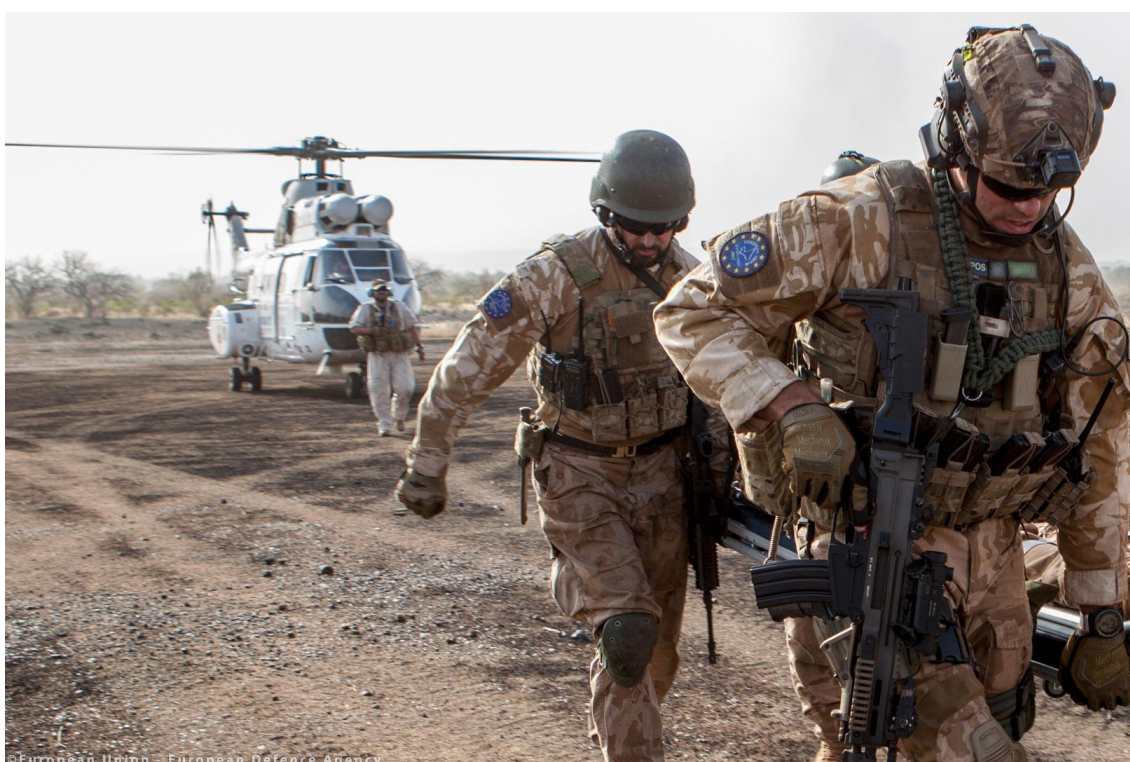
Imagen de la Agencia Europea de Defensa.

Aunque aún no existe un ejército de la UE y la defensa sigue siendo una prerrogativa nacional exclusiva, la UE ha dado recientemente grandes pasos para impulsar la cooperación.