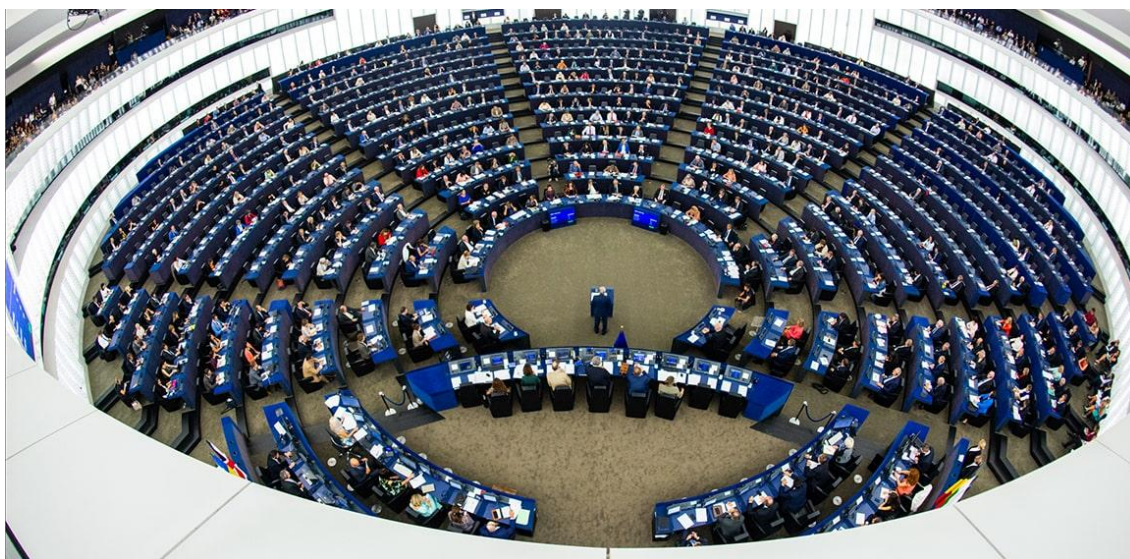
Hemiciclo del Parlamento Europeo en Estrasburgo.

Más de la mitad de los electores europeos acudieron a las urnas del 23 al 26 de mayo para elegir a los eurodiputados.