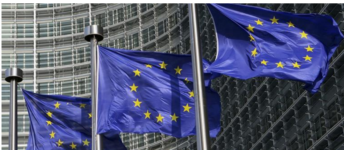
Banderas europeas en el exterior del edificio de la Comisión Europea.