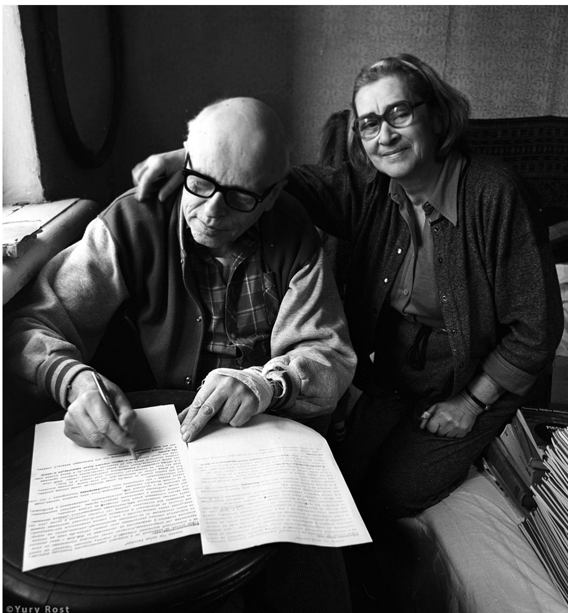
Andrej Sacharov se svou ženou Jelenou Bonner