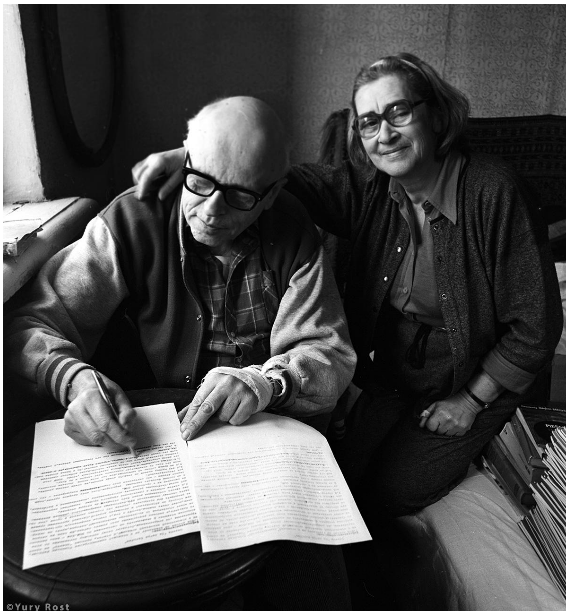
Andrejs Saharovs un viņa sieva Jelena Bonnere

5 kandidāti izvirzīti Eiropas Parlamenta Saharova balvai par domas brīvību. Lasīt tālāk, lai uzzinātu par viņu ieguldījumu, aizstāvot cilvēktiesības.