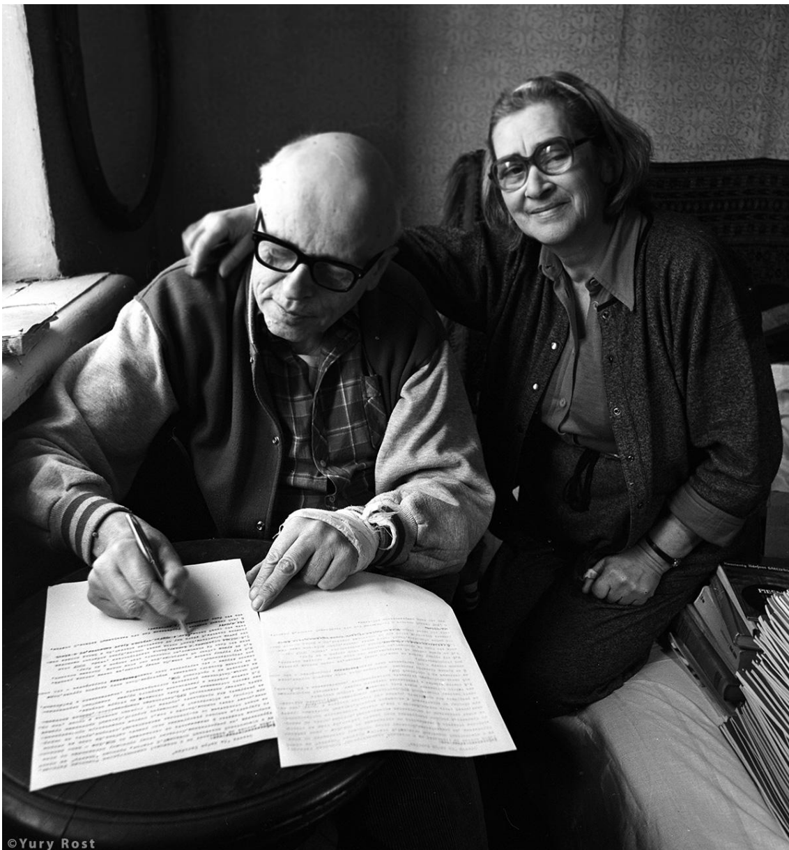
Andrej Sacharov en zijn vrouw Jelena Bonner

Hier zie je wie is voorgedragen voor de Sacharovprijs voor de vrijheid van denken van het Europees Parlement 2019.