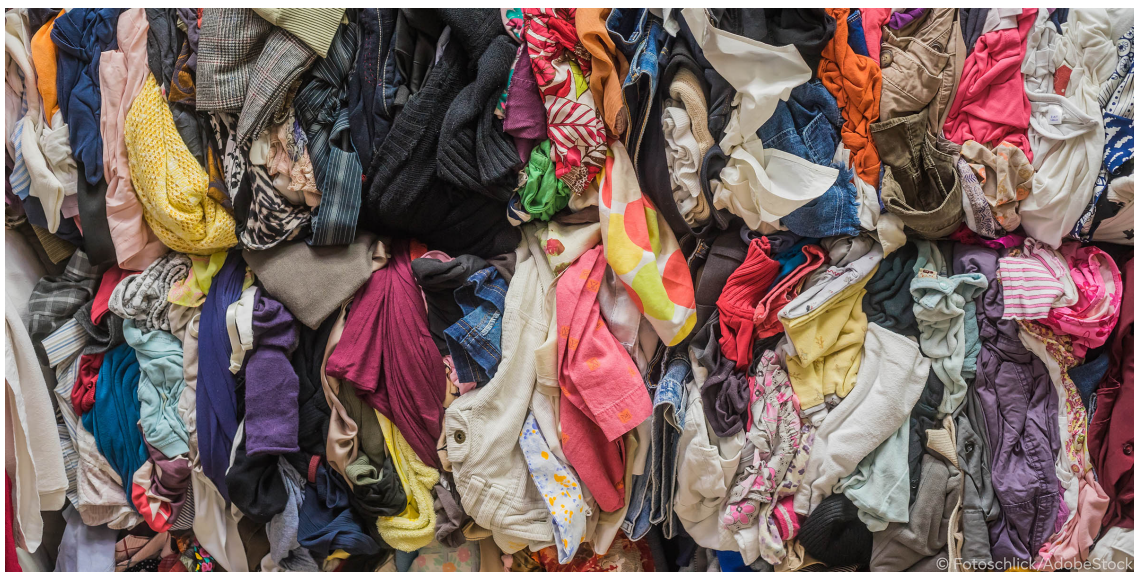
Banner: Recycling pressed bales from clothing

Με τη γρήγορη μόδα, η ποσότητα των ρούχων που παράγονται και πετιούνται έχει αυξηθεί. Μάθετε περισσότερα για τις περιβαλλοντικές επιπτώσεις και τις λύσεις της ΕΕ.