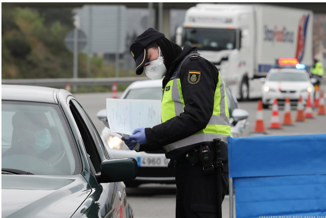
Kontrola řidičů na hranicích