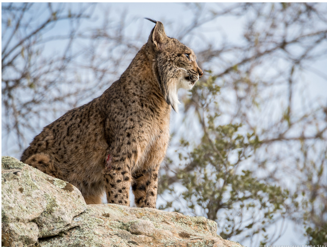
Specie de râs iberic