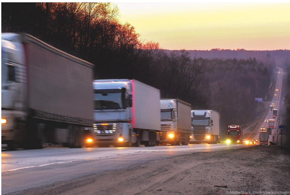
Déanfar dálaí oibre tiománaithe a fheabhsú

Soiléirítear leis na rialacha maidir le postú tiománaithe conas mar a bheidh tiománaithe gairmiúla in iompar paisinéirí agus earraí in ann tairbhe a bhaint as prionsabal an phá chomhionann as an obair chéanna san áit chéanna. Leis na rialacha athchóirithe, táthar ag iarraidh a áirithiú nach mbeidh nósanna imeachta éagsúla sna ballstáit agus a chinntiú go bhfaigheann tiománaithe íocaíocht fhéarálte.