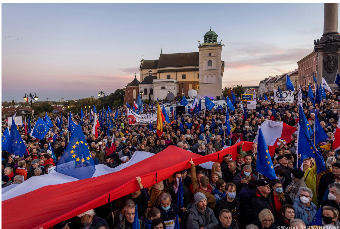
Tiotusentals människor i Polen har protesterat mot författningsdomstolens beslut