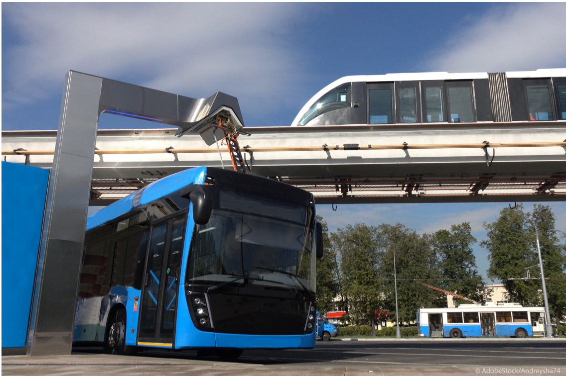
Xarabank elettriku blu fl-istazzjon tal-iċċarġjar filwaqt li ferrovija moderna fuq il-monorail tgħaddi fl-isfond

L-enerġija hija s-sors ewlieni ta' emissjonijiet ta' gassijiet serra fl-UE. Skopri kif l-UE trid iżżid l-enerġija rinnovabbli u tiddekarbonizza s-settur.