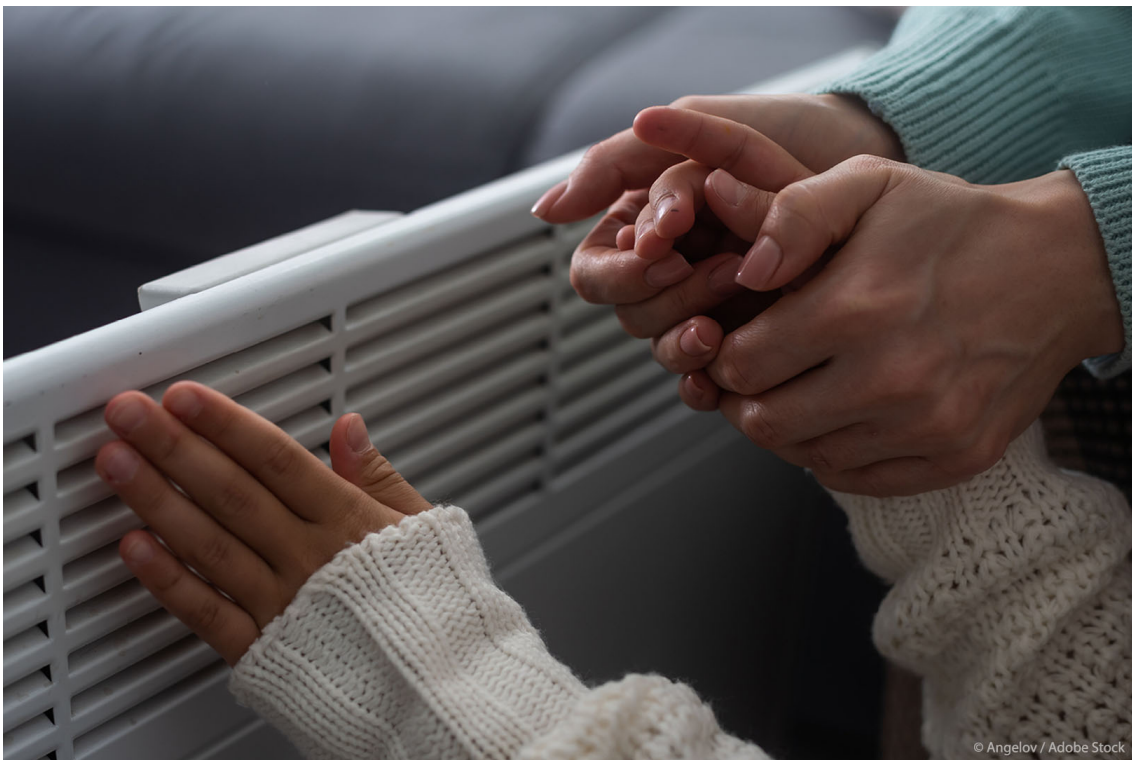
Az energiaszegénység nemekre gyakorolt hatásai

Az egyedülálló nők és az egyedülálló anyák számára nehezebb az energiaszámlák kifizetése, mint a férfiak számára. Tudjon meg többet a megélhetési válság hatásairól!